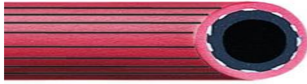
Acitelēna gumijas šļūtene.